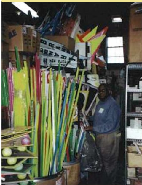
KREATÍVNY SKLAD PRE ZNOVUPOUŽÍVANIE V CHICAGO HTTP://WWW.RESOURCECENTERCHICAGO.ORG

Ľuďi kurzy starania sa o svoj bicykel, opráv bicykla, tuningov. V rámci programu je prevádzkovaný bicyklový obchod s bazárom.