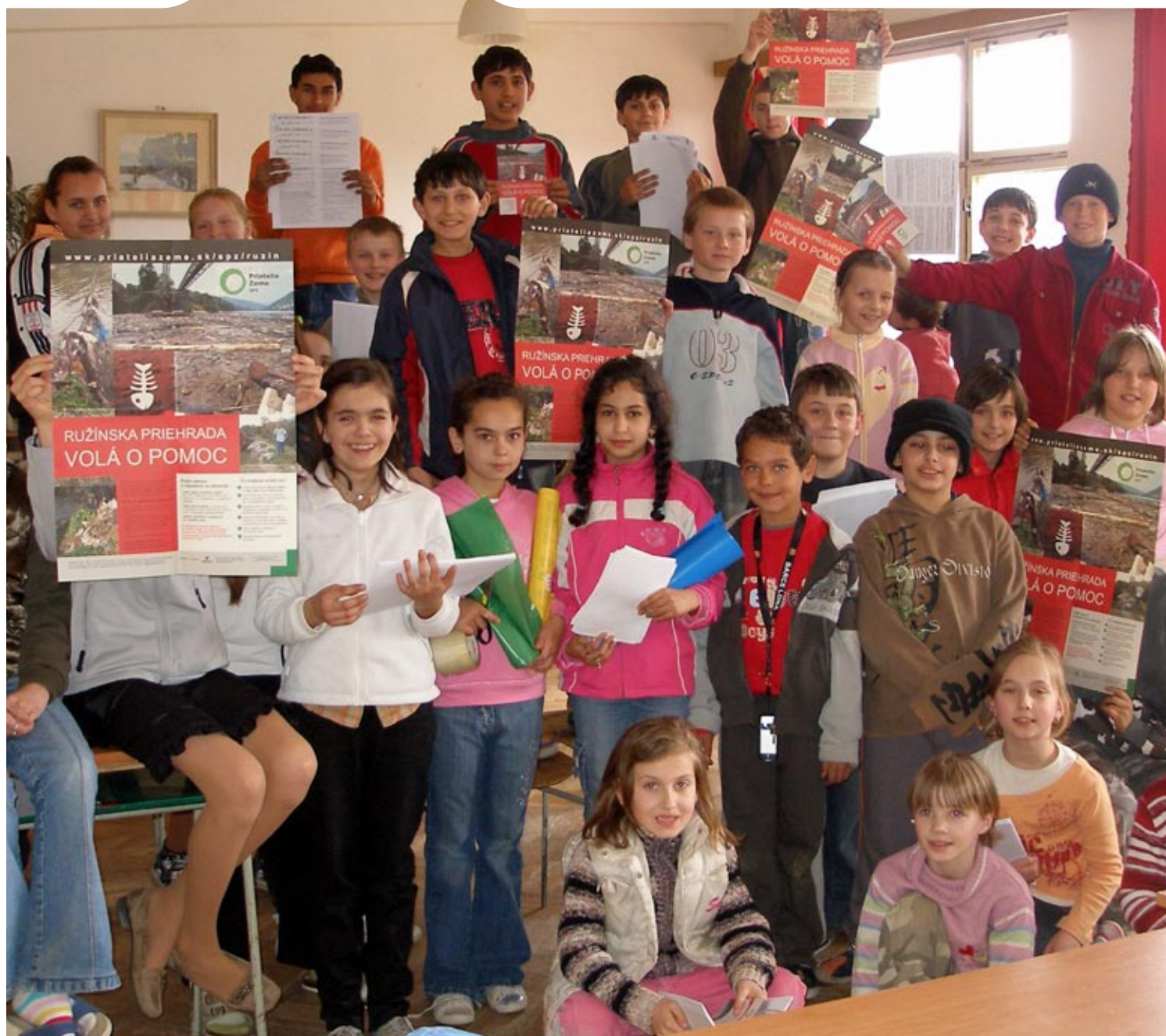
Žiaci z Helcmanoviec pomáhali pri osвете o znečistení Ružinskej priehrady

ekotipy: Urobte si doma recyklovaný papier