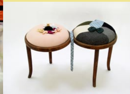
STOLIČKA PRE DVOCH VZNIKLA SPOJENÍM DVOCH STARÝCH POKAZENÝCH STOLIČIEK. ŠTUDENTSKÁ PRÁCA, STREŠNIA ŠKOLA ÚŽITKOVÉHO VÝTVARNÍCTVA J. VYDRU, BRATISLAVA