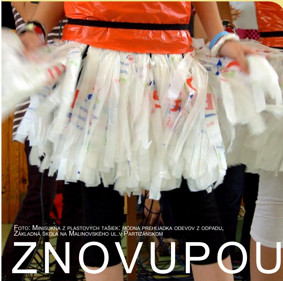
FOTO: MINISUKŇA Z PLASTOVÝCH TAŠIEK: MÓDNA PREHLIADKA ODEVOV Z ODPADU, ZÁKLADNÁ ŠKOLA NA MALINOVSKÉHO UL. V PARTIZÁNSKOM