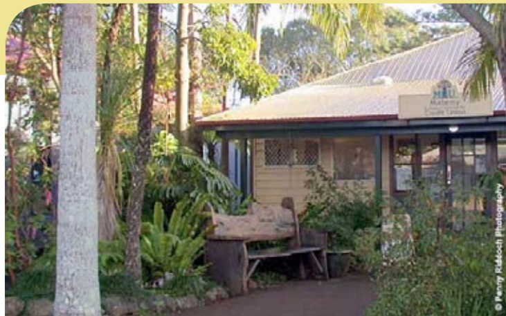
DRUŽSTEVNÁ ZÁLOŽŇA V MALENY