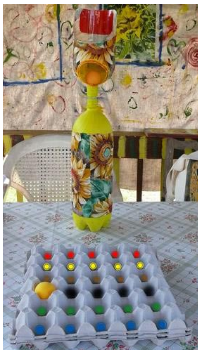
FOTO: PET BASKETBAL, AUTOR JÁN RIDEG, AUTOR FOTOGRAFIE, ZDROJ: HTTP://ACELOVA.BLOG.SME.SK

Ďalším programom Resource Center je Kreatívny sklad pre znovupoužitie .